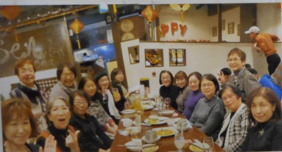
新年会 ベトナム料理店