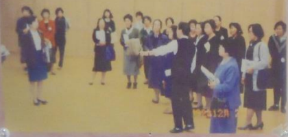
他市の女性センターを見学