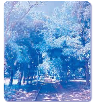
緑豊かな行田公園のコース