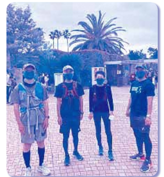
メンバーでのマラニック