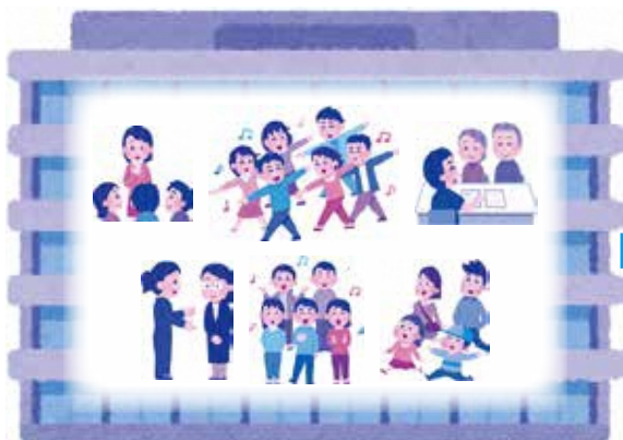
大きな会場に集まって開催