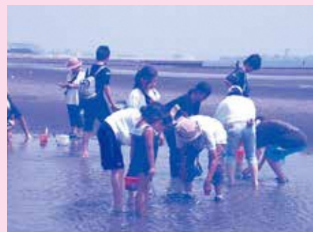
干潟でのアサリ採取