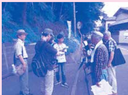
がけ崩れ等の危険個所の調査