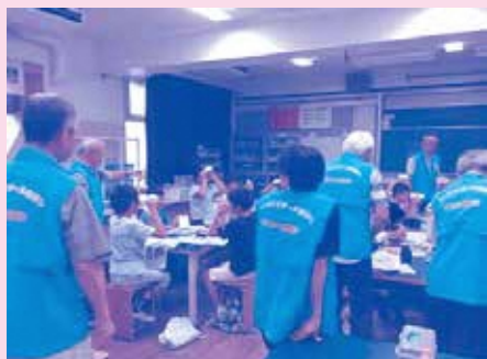
工作体験の講座のサポート