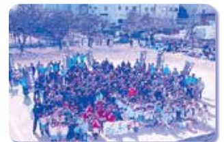
バルコニノス杯 (サッカー大会)

他団体へのメッセージ コロナ禍で思うような活動ができない厳しい状況が続いておりますが、各団体が工夫をしながら乗り越えて行きましょう！