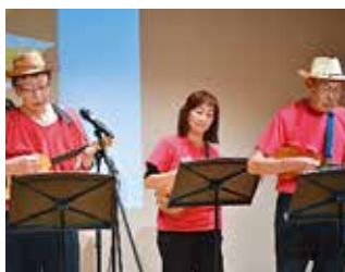
ウクレレの皆さん楽しそう