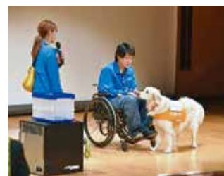
介助犬に癒される