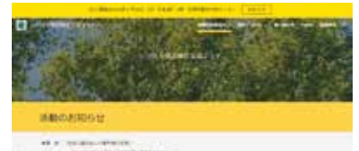
①団体HPトップページ

とにかくやってみよう！ という気持ちでチャレンジして本当に良かったと感じています。