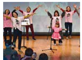
笑いヨガで元気をもらおう