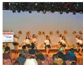
チアダンスでみんな笑顔に