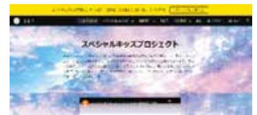
②団体HPトップページ